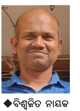
◆ ବିଶ୍ଵକିତ ନାୟକ

ନାରୀ ଚିନ୍ତା କାନ୍ଦିପାରେ ବୋଲି ତ ନିଜ ଲୁହର ସମୁଦ୍ରେ ଭାସିବାର ଛାଡ଼ିବ କୋହ ମନର ଲହରୀ, ଆଶୁଛି ଅନୁଭବ କରେ ନିଜ ହୃଦୟ ମଧ୍ୟରେ ହକଦାର ପାଳନାୟକ ସମବେଦନା ସାଉଁଟିବାକୁ ! ପୁରୁଷତ୍ଵ କାନ୍ଦିପାରେନି କି କହିପାରେନି ନିଜ ଛାତିର ବେଦନା ତାପିରଖେ ମନ ଭିତରର ଅସରନ୍ତି କୋହକୁ, ନିଜ ଦାମିଲା ଛାତିରେ ବାନ୍ଧିରଖେ ଆଖିରେ ଅସରନ୍ତି ଲୁହର ସମୁଦ୍ରେ ! ପୁରୁଷତ୍ଵ ନିଜର ସବୁ ଯତ୍ନ ଚାପିରଖି ନିଜ ଛାତି ଭିତରେ ଓଠରେ ରଖୁଥାଏ ସବାବେଳେ ହସଟିକୁ, ଏ ବିଚିତ୍ର ଦୁନିଆ ତଥାପି କିଛି ଜାଣି ପାରେନି ପୁରୁଷ ଚିର ମନ ଭିତରର ଅବେଶା କୋହ କୁ !