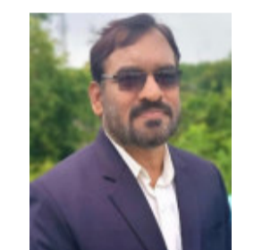
◆ ଅଧ୍ୟାପକ ଗୋପବନ୍ଧୁ