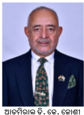
ଆଡମିନିଷ୍ଟ୍ରେଟିଭ. କେ. କୋଶା