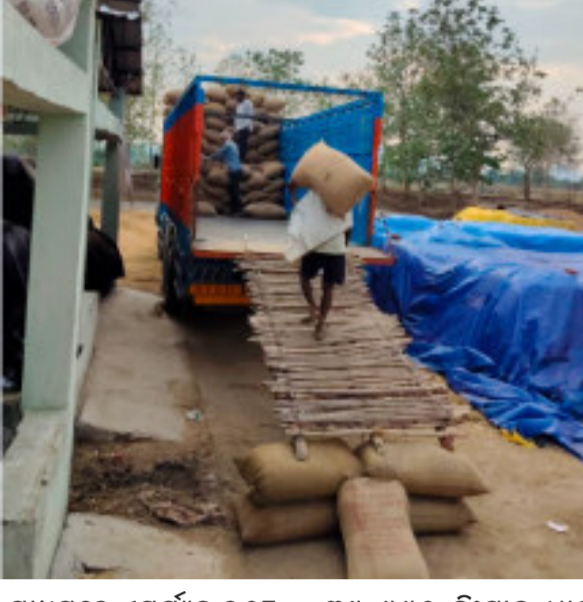
ମାଧ୍ୟମରେ ଏପର୍ଯ୍ୟନ୍ତ ୭୬୮ ଜଣ ଚାଷୀଙ୍କଠାରୁ ସମୁଦାୟ ୩୯,୯୯୧ କିଂଟାଲ ଧାନ ଅଧିଗ୍ରହଣ କରାଯାଇଛି ।

ନୂ ଆପ ଡି. (ନି.ପ୍ର.) : ନୂଆପଡ଼ା ଜିଲ୍ଲାରେ ଚଳିତ ରବି ଧାନ ଅଧିଗ୍ରହଣ କାର୍ଯ୍ୟକ୍ରମ ପୁରା ଭାବେ ଜାରି ରହିଛି । ଜିଲ୍ଲା ପ୍ରଶାସନର ତତ୍ତ୍ୱାବଧାନରେ ଚାଷୀମାନଙ୍କ ଠାରୁ ସ୍ୱଳ୍ପ ଓ ଶୁଖଳିତ ଭାବେ ଧାନ କ୍ରୟ କରାଯାଇଛି । ଲୁନ ଗାଡ଼ିଖ ପୁଷ୍ଟା ଜିଲ୍ଲାର ୨୨ଟି ପଞ୍ଚାତି ପ୍ରୋକ୍ୟୁରମେଣ୍ଟ ସେଣ୍ଟର (ଚରଭ) କାର୍ଯ୍ୟକ୍ଷମ ରହିଥିବା ବେଳେ ୨୩ଟି ଜଣ ଚାଷୀଙ୍କ ଠାରୁ ମୋଟ ୧୨,୩୯୮.୬୯ କିଂଟାଲ ଧାନ କ୍ରୟ କରାଯାଇଛି । ଜିଲ୍ଲାରେ ମୋଟ ୨୪ଟି ପ୍ରାଥମିକ ସମବାୟ ସମିତି