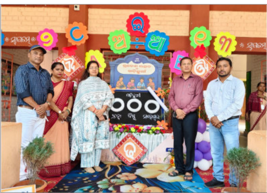
ଖଡ଼ି ଛୁଆଁ ଆମ ଓଡ଼ିଆ ସଂସ୍କୃତିରେ ଏକ ପବିତ୍ର ପରମ୍ପରା ବୋଲି ଅଭିହିତ କରିଥିଲେ ।